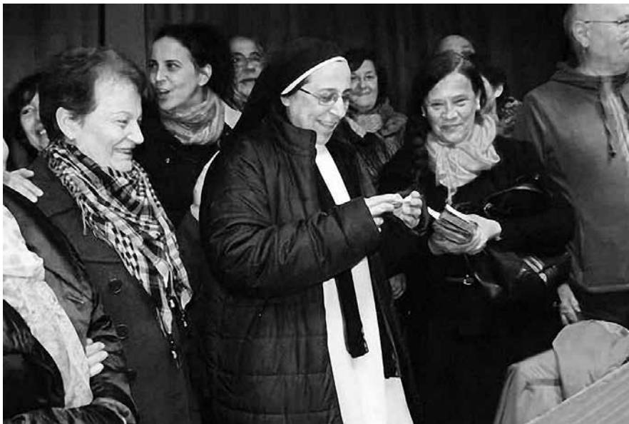
Sor Lucía acompañada de varios membros da comunidade da Cristo da Vitoria

que son imperdoables. Defendo que Artur Mas non roubou. En canto ao do independentismo, Mas fixo unha opción por esa vía tras escoitar o pobo (recordo a manifestación do 11 de setembro). Pero creo que máis importante que pedir a independencia neste momento é ter un modelo de país no que a xente poida ser libre e independente porque vive con dignidade, con menos recortes sociais. A xente no centro das políticas. Iso pónollo no debe do presidente da Generalitat, pero xa queredo España ter un presidente como Artur Mas.