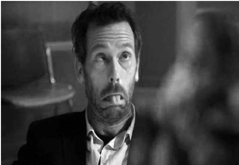
Fixo un ricto diante daquel rito

O outro día démoslles un repaso a esas palabras que mudaron a súa ortografía a partir de 2003. Antes mantiñan o grupo culto (ct ou cc) igual ca en castelán e agora non o teñen. Lembrades termos tan comúns como vitoria , vítima , condutor , dicionario ...? Seguramente agora xa escribides ben produto e redución , pero non vaiades confundirvos e “pasarvos de freada”. Lembra que estes grupos cultos perden o C, só diante de I e U. Isto quere dicir que palabras