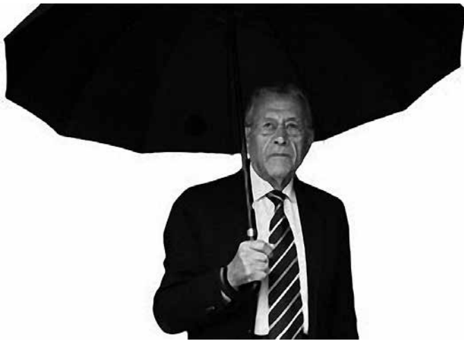
Santiago, o home do tempo

Había quen se queixaba hoxe por aquí polas Rías Baixas de que cho-vía que metía medo. Houbo quen lle tapou a boca... «É o tempo...!» Pois claro que é o tempo! É o tempo de chover, de ventar, de ir frío... É o tempo deste tempo... É mellor que veña agora ca cando non ten que vir, cando estrague a anada... Está un tempo de outono mesmo!