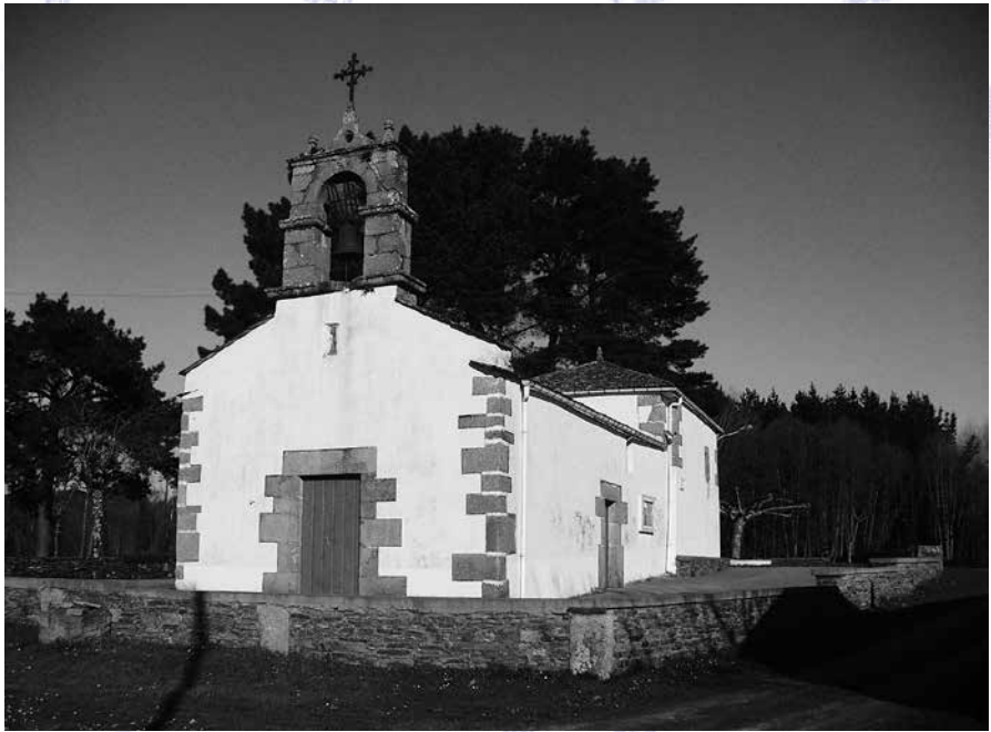
Igrexa de Duarría