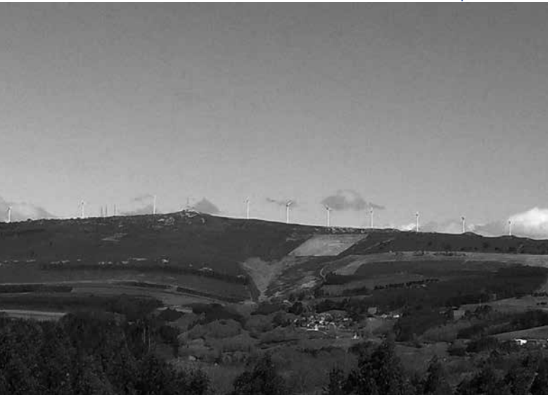
Pedregal de Irimia 2012