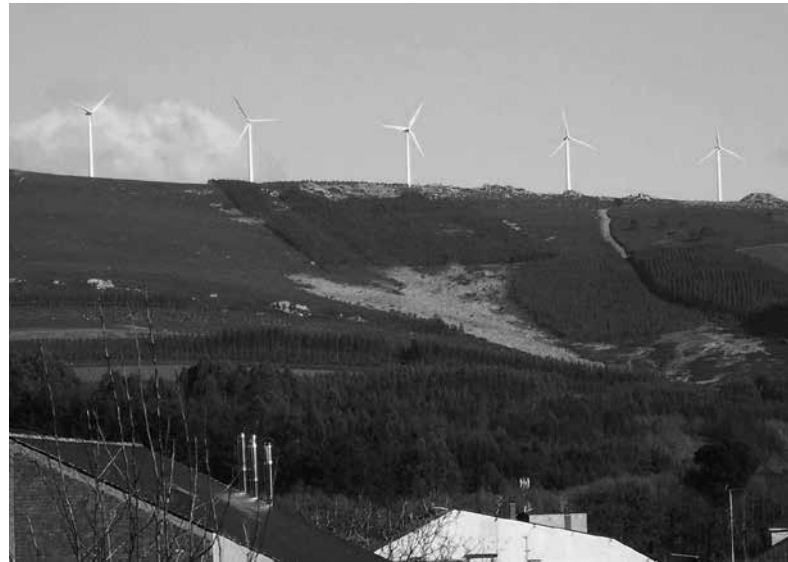
Pedregal de Irimia 2015