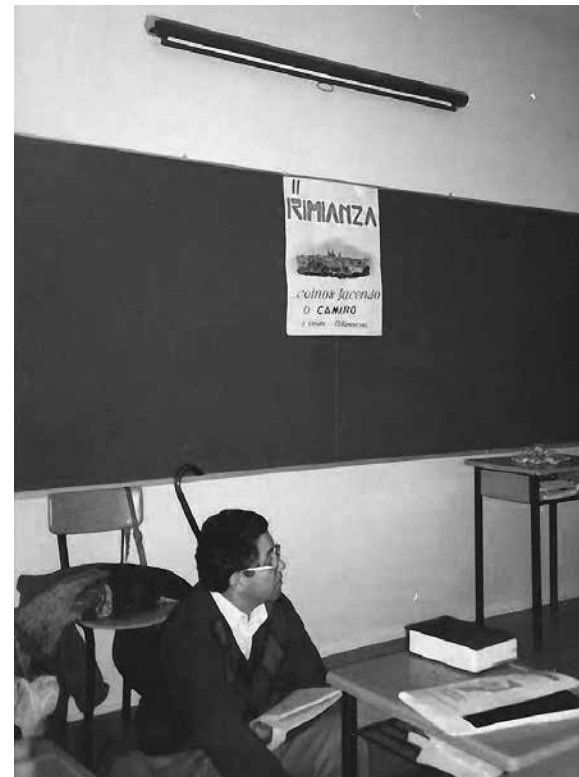
Organizando unha Irimianza