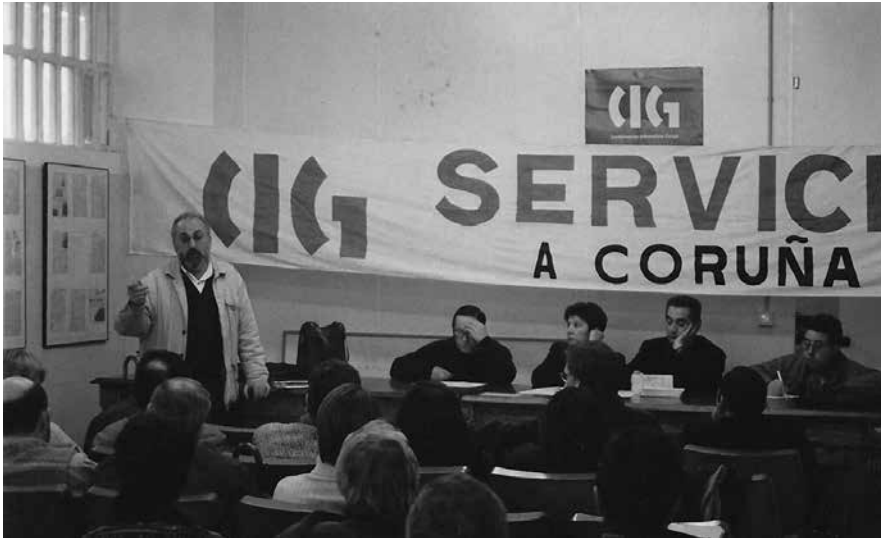
Nunha xuntanza do sindicato

Anuncio: Non entendiamos certos comportamentos cívicos, non había palabra, tirábanse as cousas ao chan e aquí as xestións administrativas eran lentas e confusas; alá coas catro palabras que sabiamos solucionabas todo.