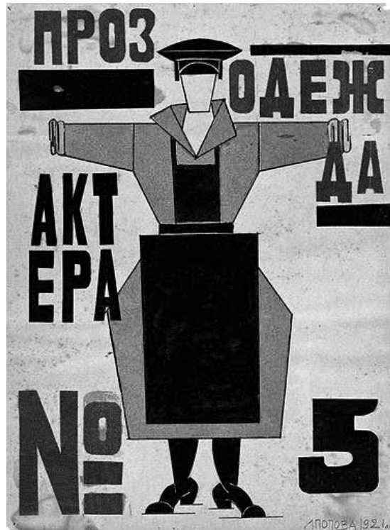
vestiario deseñado por Popova Liubov. "Producción de Roupa para Actor nº 5" (1921), traxe dun actor feminino para a obra vanguardista de Fernand Crommelynck, "The Magnanimous Cuckold" (1922).

Soubemos modelar e modular capitalismo e socialismo para evitar os peores trazos de cada un? Se cadra, pero quedámonos polo camiño. Hoxe necesitamos repensar as fórmulas que nos permitan converter o mundo nun lugar seguro e máis xusto, onde a liberdade e a igualdade sexan principios e medios de convivencia. O resto son prexuízos. E todos andamos sobrados deles.