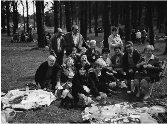
Na romaxe de Irimia

Anuncio: Desta volta o meu traballo era servir o viño aos convidados, cando os había. Estabamos moi ben alí.