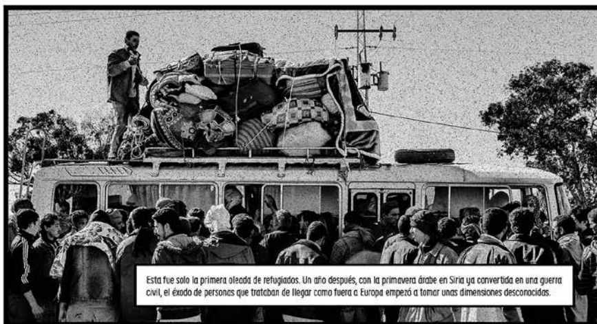
Esta fue solo la primera oleada de refugiados. Un año después, con la primavera árabe en Siria ya convertida en una guerra civil, el éxodo de personas que trataban de llegar como fuera a Europa empezó a tomar unas dimensiones desconocidas.

A fenda é unha historia necesaria que nos recorda a necesidade imperiosa de reconstruír os países destruídos, porque ninguén deixa a súa casa desa forma se non é obrigado. A fenda tamén nos recorda a nosa demostrada incapacidade para conseguir solucións. As fronteiras seguen sendo eses lugares que concentran a impotencia dos desfavorecidos e dos que desexamos esquecernos diariamente...sen conseguilo.