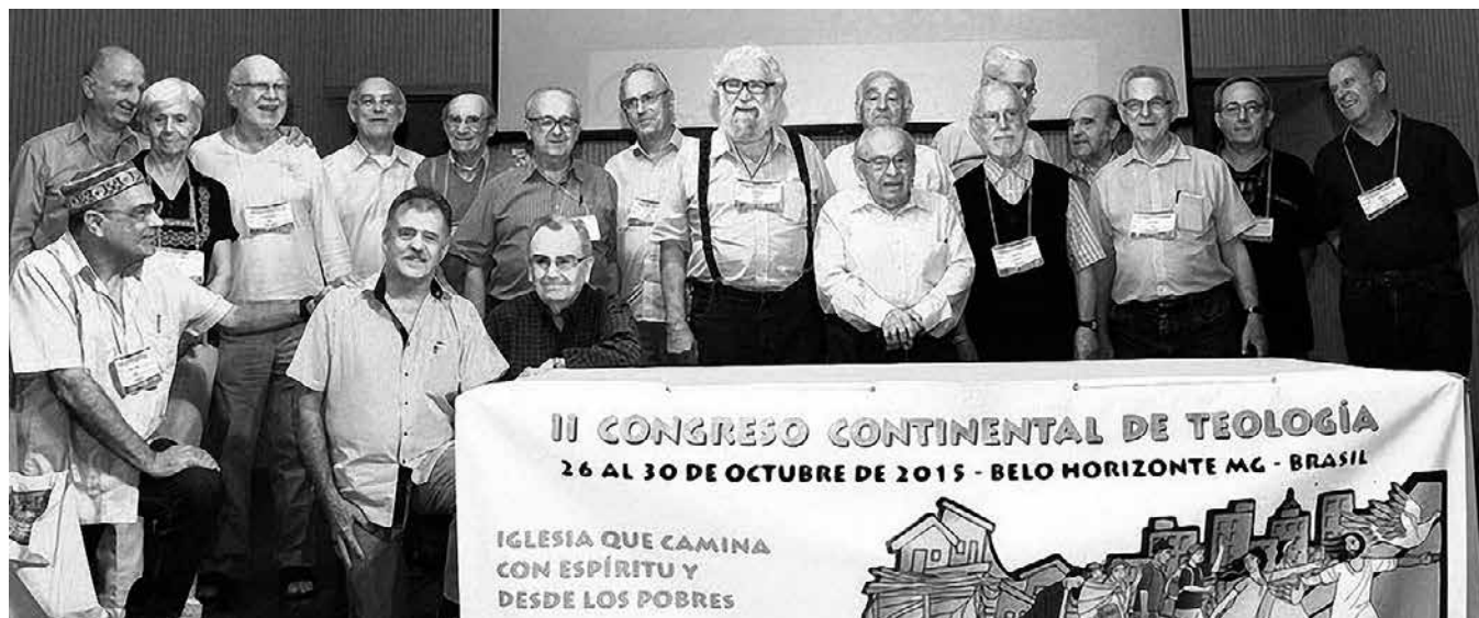
Boff, Gutiérrez e outros teólogos nun congreso organizado por Amerindia no ano 2015

Por lei de vida, a gran xeración de teólogos que fixeron posible a renovación teolóxica que levou a cabo o concilio Vaticano II está a punto de extinguirse. E nas décadas seguintes, por desgraza, non xurdiu unha xeración nova que puidese continuar o labor que os grandes teólogos do século XX iniciaron. Os estudos bíblicos, algúns traballos históricos e algo tamén no que se refire á espiritualidade son ámbitos do quefacer teolóxico que se mantiveron dignamente. Pero incluso movementos importantes, como ocorreu coa teoloxía da liberación, dan a impresión de que se están vindo abaixo. Oxalá me equivoque.