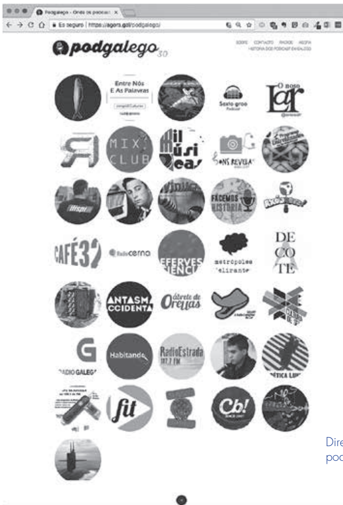
Directorio de podcasts en galego

ga pese a ser moi nova xa ten grandes xoias e de seguro que pode ter moitísimas máis.