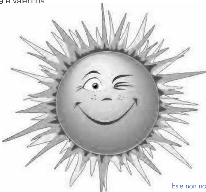
Este non nos para!

Abafando, afogadas, atafegadas, acoradas, moi sufocadas, coa lingua fóra, a suor a correr polas nosas meixelas..., así nos pillamos a volta ao novo curso que, xa desde hai ben tempo, nas nosas vidas comeza con Irimia ... E continúan a contar con nós! Que atrevidos estes da mesa de redacción! Vós o que non sabedes é canto nos facemos de rogar... “Lingua a tempo!” oímos case todos os números... Pero vaia, volvéronnos convocar para esta nova tempada e estamosvos moi contentas e agradecidas. E facendo propósito de emenda, nós empezamos