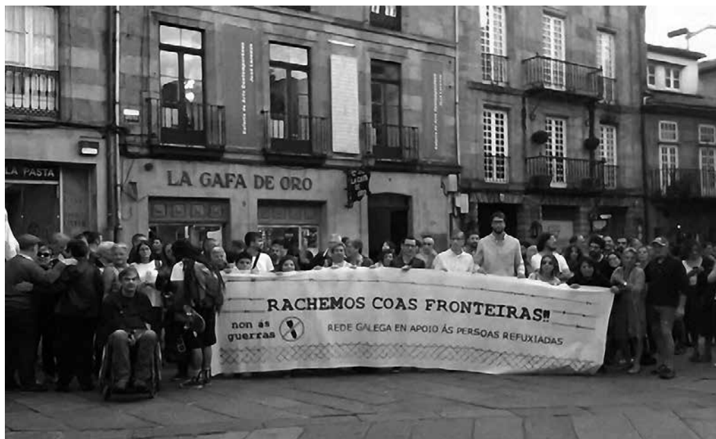
Acto na praza do Toural