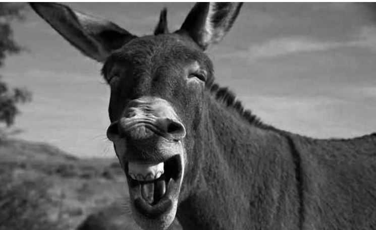
A, a primeira letra que o burro dá!

Como os días van minguando, pareceunos oportuno dedicar o número de hoxe a esas palabras “pequenas” pero importantes na lingua, para que non falemos coma Tarzán. Referímonos ás preposicións e ás conxuncións. Non vén ao caso presentarvos aquí listaxes, así que acordamos comezar por comentar aquelas que detectamos que dan máis problemas na escrita.