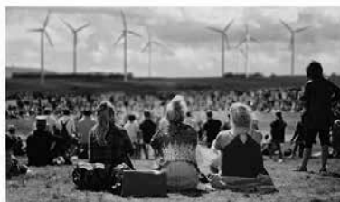
I Encontro de Mulleres con Enerxía Cooperativa