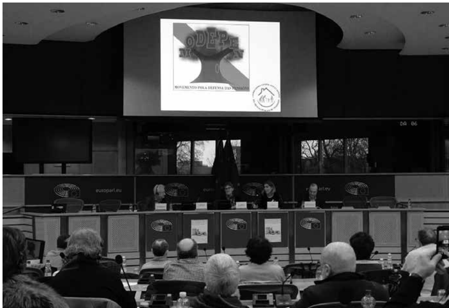
Debate sobre as pensións en Europa con representantes de xubilados de Cataluña, Grecia, Francia e Italia

digna. O problema non está no envellecemento, senón no inxusto reparto da riqueza, que só unha minoría privilexiada trata de acaparala a mans cheas.