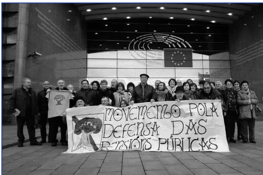
Representantes de Modepen ás portas do parlamento Europeo

cial, resulta de un cinismo descarnado e miserable. Afirmamos moi alto e claro que os vellos de hoxe nada lle deben a esta sociedade de consumismo, gasto desmedido e corrupción. Foron os maiores de hoxe quen fixeron o maior esforzo de produción e xeración de riqueza histórica para España, construíndo escolas e universidades, vivendas e hospitais, portos e aeroportos, estradas e autoestradas, incrementaron a produción alimentaria e cultural. A estas xeracións correspóndenos, por razóns de xustiza histórica, proporcionarlle unha vida