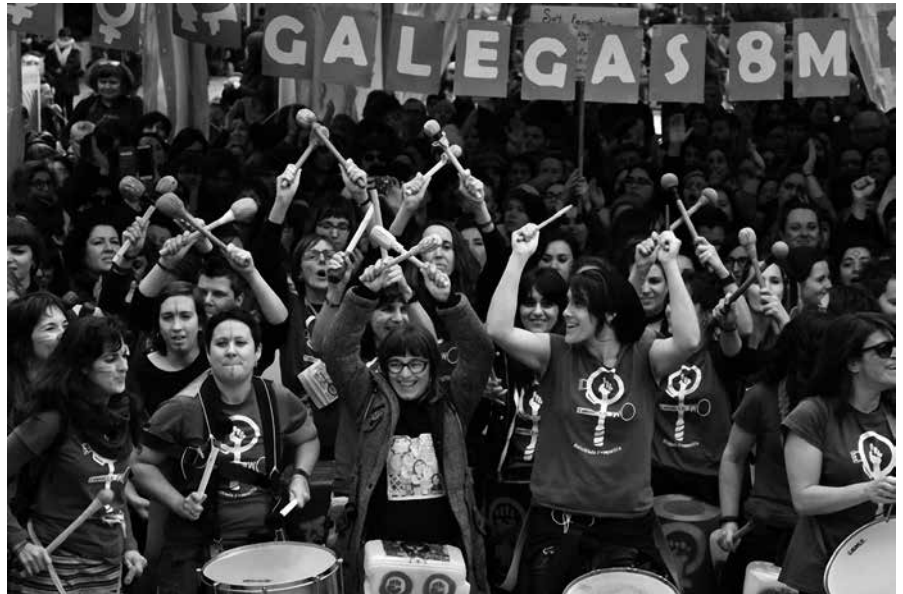
As Tamborilás da batukada feminista na manifestación de Vigo

As mobilizacións feministas do pasado marzo sorprenderon a toda a sociedade e marcaron un antes e un despois na historia da loita pola igualdade. En termos relativos, Galicia foi un dos territorios onde a mobilización foi máis intensa.