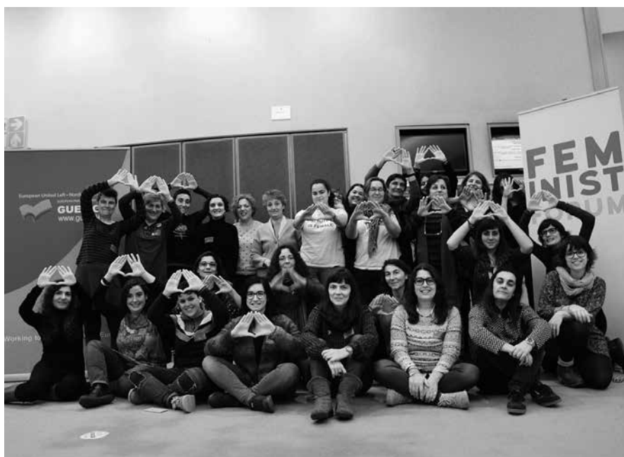
A autora do artigo entre as asistentes ao Foro “Feminismo sen fronteiras” celebrado en Bruxelas

Fronte ás discriminacións e inxustizas da dereita máis reaccionaria neste contexto atroz neoliberal que estamos a vivir, o feminismo é o freo necesario e urxente.