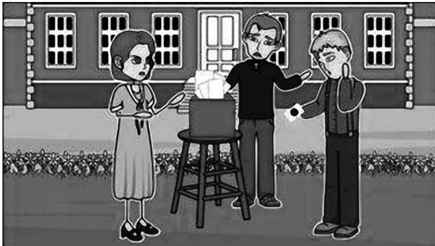
Debuxo de Miles Hyman, que converte en cómic o relato de Shirley Jackson

Hai setenta anos Shirley Jackson escribiu un dos relatos curtos que aínda hoxe en día segue sendo dos máis truculentos publicados, A lotería . Está ambientado na praza dun pobo pequeno, na que se reúnen todos os seus habitantes para xogar a unha lotería moi especial. Son dez páxinas e, se non queredes que volo estrague, aparcade un instante a lectura deste artigo, buscade o relato en Internet, lédeo e continuade logo con esta lectura.