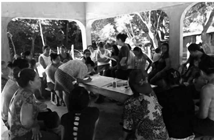
Encontro de mulleres en san Luis de Manareca