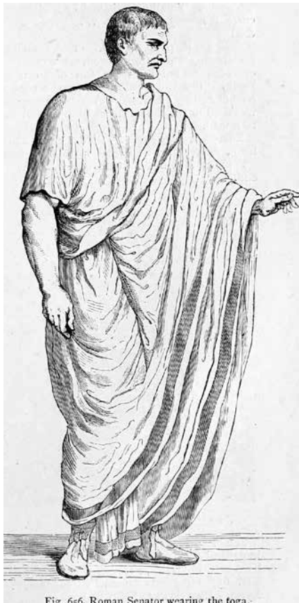
Fig. 6c6. Roman Senator wearing the toga.