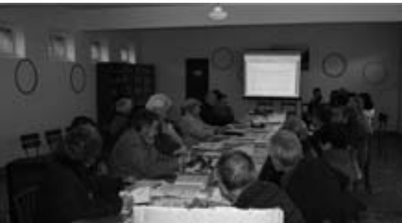
A asemblea: rendendo contas