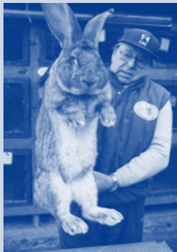
Coáchela coma un cazapo, conselleiro

Disque é costume comezar o ano cuns obxectivos que se van vendo adiados por outros máis urxentes. No comezo das listas adoitan os de anotarse no ximnasio para atacar as calorías, acometer unha reforma doméstica, esquecer idiomas... Este último é o propósito máis grato ao goberno galego, sobre todo se o que se quere esquecer é o propio, xaora. Para celebrar o primeiro cabodano do decreto contra o galego -que vén sendo a disposición máis contraria á nosa lingua que ninguén