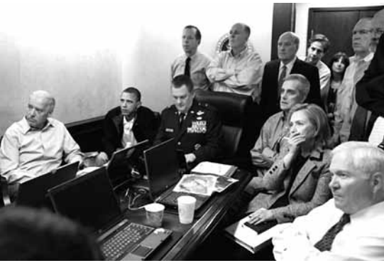
o gabinete da Casa Branca seguindo o asasinato de Bin Laden

Non damos creto. Parecera como que volve a poñerse de moda a Rambo-manía, si algunha vez deixou de estalo, por aquilo de que a realidade supera sempre á ficción. Non foi suficiente con eliminar a Osama Bin Laden violentando a soberanía nacional de Paquistán. De executalo, sen miramento algún, para logo tiralo ao mar, iso si, polo rito musulmán.