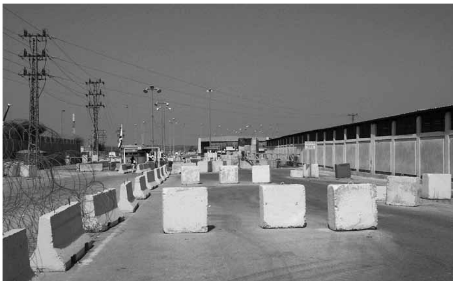
Eretz, porta de acceso a Gaza: un territorio illado

indignación tremenda, unha tristura fonda, e unha dor infinita; mais tamén coa admiración eterna por unha poboación que non perde a afabilidade nin o sorriso, e pola súa capacidade de resistencia. E coa determinación de non esquecer, e de contar. E de traballar no que poidamos para que o pobo palestino poida vivir na súa terra decidindo o seu presente e mais o seu futuro en liberdade.