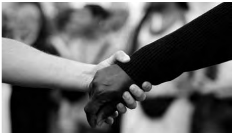
manifestación contra o racismo e o antisemitismo, celebrada en Francia despois dos atentados

En definitiva a través da educación, a xusta distribución dos recursos e o desenvolvemento dos dereitos humanos é como podemos chegar a unha profunda cultura de paz, eliminando moitas das causas que provocan estes desgraciados conflitos.