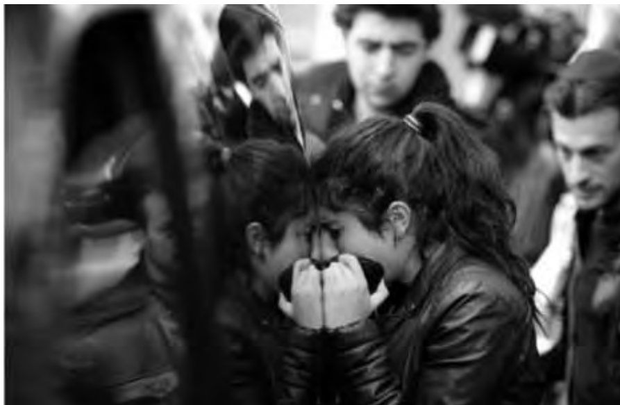
Despois da masacre en Toulouse

Un novo terrorismo ameaza Europa. Os casos de Noruega e Francia demostran un novo terrorismo individual e solitario mesturado de vinganza e fanatismo. A iso engádesse unha política emigratoria europea errónea, mal utilizada por veces nas campañas electorais, principalmente cunha ideoloxía de ultradereita. Trátase en ambos os casos de asasinatos con bagaxe diferente yihadistas ou de extrema dereita, que empregan métodos similares. Adoita ser unha soa persoa armada que atenta contra cidadáns anónimos e que, desa forma, pode escapar máis facilmente ao control policial. Entre as motivacións, hai sempre unha mestura de discurso político e perfil persoal de frustración, furia e repercusión social.