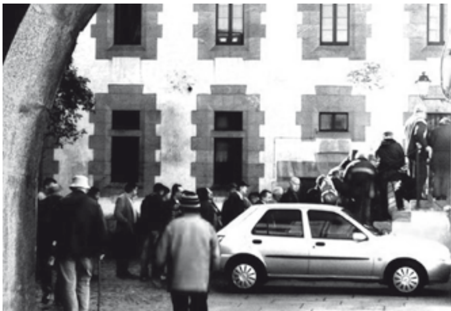
Foto do 21-O, o que pasa é que non é a cola para un colexio electoral, agardan a que abra a cociña económica [vía Twiter].