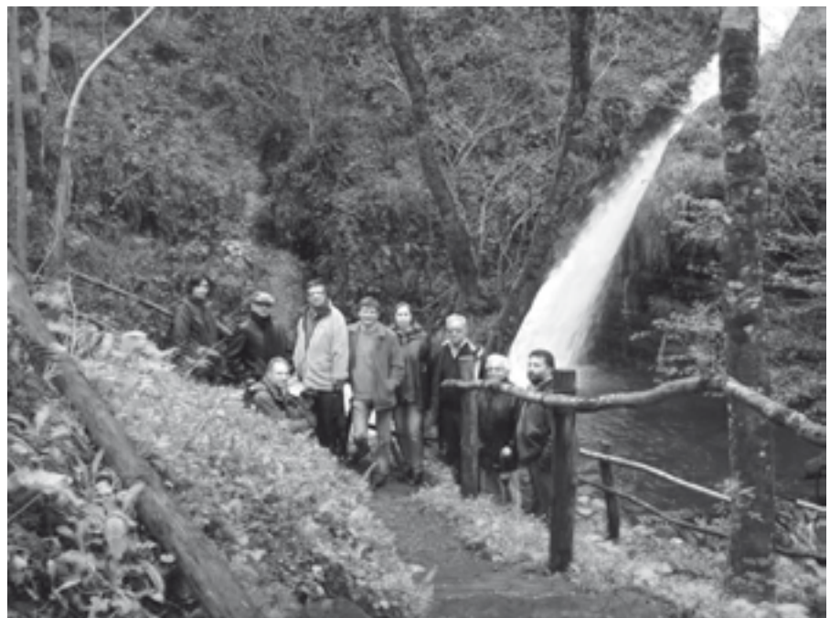
Roteiro Acebo-A Fonsagrada-A Póboa de Burón-Córneas

Tamén vos quero agradecer -aproveito- que me fixesedes partícipe desta entrevista e vou estender o agradecemento a todos os/as socios/as e, sobre todo, á Xunta Directiva de Amigos do Patrimonio, especialmente a algúns que non quero citar, mais que xa me entenden.