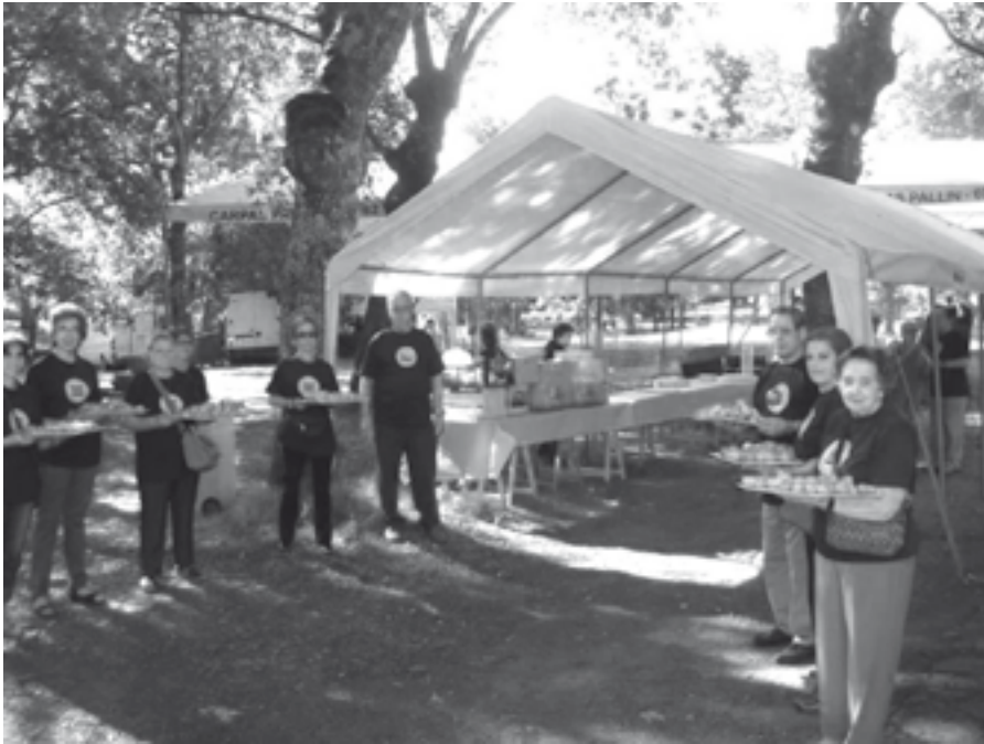
A boa xente de Castro Verde, na benvinda aos romeiros.

seguir desenvolvéndose vai depender das posibles axudas Institucionais. Por outra banda, pensando principalmente nos rapaces do noso concello, tamén organizamos actividades no CPI de Castroverde.