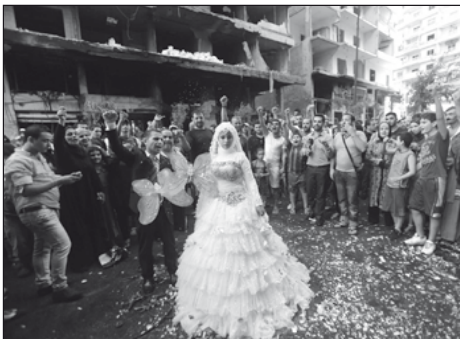
Libano: a teimuda afirmación da vida. Unha parella celebra o seu casamento no mesmo lugar onde dous días antes un coche bomba matou vinte e sete persoas.