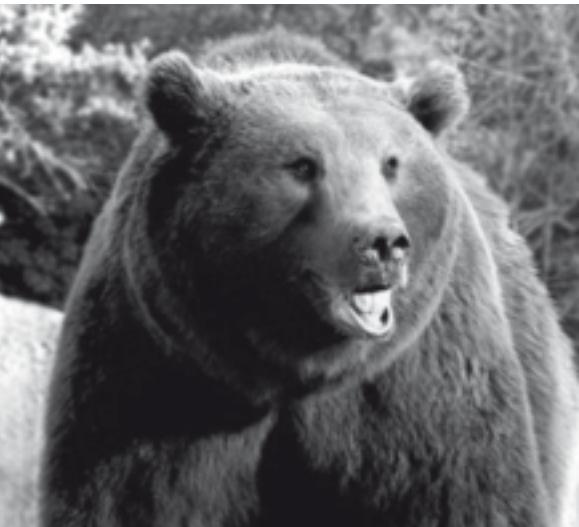
Quen o pillara! Tamaño churrasco de carne de oso!

A rapaza é madrileña de pais galegos e, despois de botar xullo e agosto na terra dos proxenitores, comeza setembro na escola privada da capital e cóntalles que na casa dos avós comeu moita “carne de oso”...- “Ay que curiosos tus familiares gallegos que comen osos!”- dille a mestra á nai