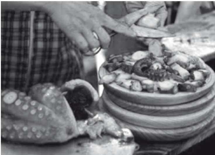
e para polbo o tamén

El Carballiño (ou incluso El Carballino!), cantas veces o oiriamos E ó lado ... El Porriño, San Cristóbal, Mellid, Rianjo, Rajó, Seijo, Poyo, La Coruña Non se salva ninguén, a lista pode ser moi longa Si, porque o de “Roblecito” xa ten unha boa volta de retranca, pero as outras todos e todas sabemos que son reais coma a vida mesma, tanto na fala coma na escrita, tamén na rotulación pública, a pesar do artigo 10 da Lei 3/1983, na que se declara que “Os topónimos terán como única forma oficial a galega”. Hai aínda quen non quere darse por informado