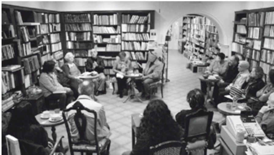
Presentación do libro en Ourense

partícipe, non moi comprometido, se puxese ao servizo da policía secreta.)