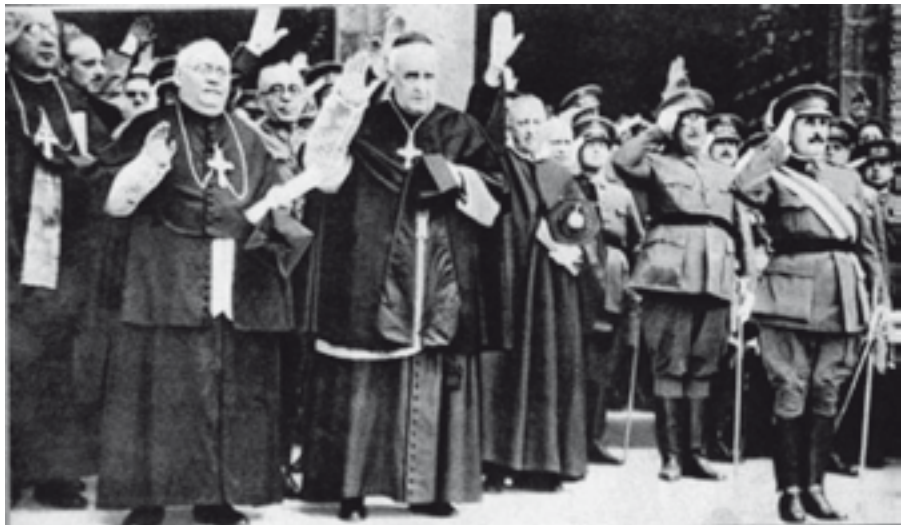
○ contexto era o que era

(Acordan Antón e Anxo que, ás veces, era como se nas asembleas houbera algún infiltrado, por exemplo nas reunións de Masma e Ribadeo, “sabían o que estabamos a tratar?” Entraba dentro do posible que un