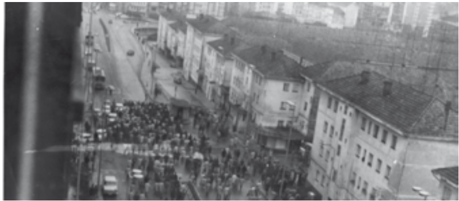
Manifestación en Ferrol nos días críticos

Como o tema era moi serio, e como aínda hai quen defende a ditadura franquista, eu quería documentos que os apoiasen, para que non os tomasen por tolos ou inxenuos. Como nas ditaduras, sexan de dereitas ou de esquerdas, sempre hai a policía política cuxa obriga é manter o ideario a base