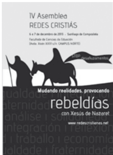
Cartaz da IV Asemblea de Redes Cristiás

Transformando a Teoloxía das Comunidades, a experiencia da comunidade do Cristo da Victoria... que si teñen un carácter máis eclesial.