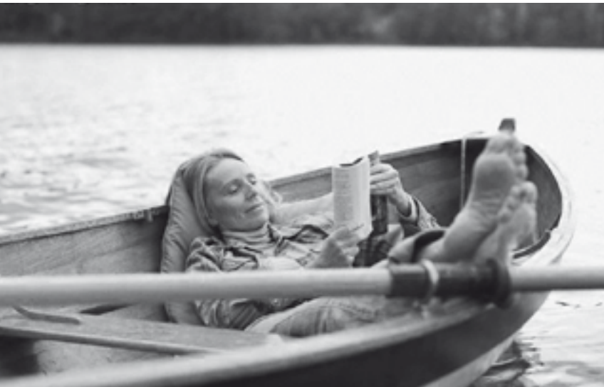
Coas canas enxoitas, non se pillan as troitas

“Atrás dun penedo pariuno súa nai, correu pola terra e casou no mar”