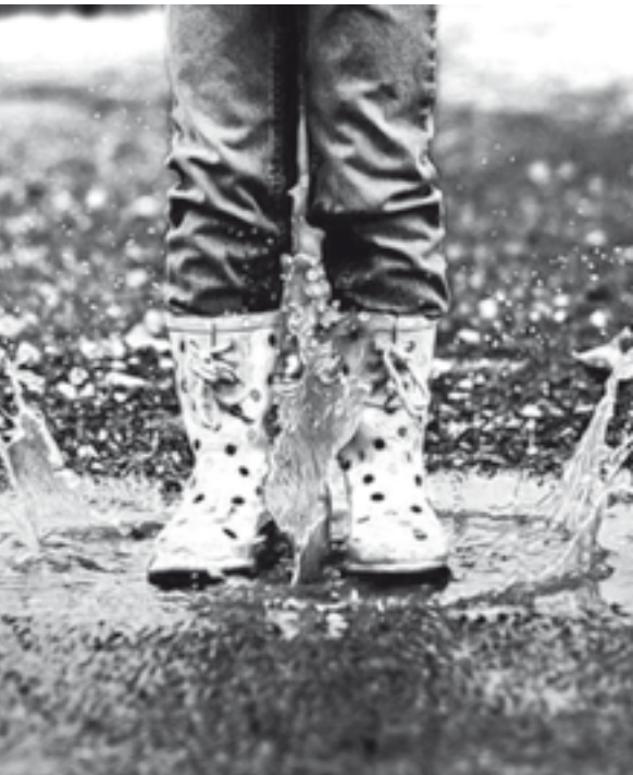
Saltar nas pozas, a felicidade...

Hai unhas semanas, cando chovía ben, chegounos un correo electrónico dun lector do concello de Paderme, na Coruña. Facíanos unha consulta respecto do anuncio de Gadís, no que os actores corean unha e outra vez, con acento ben pouco galego en moitas ocasións, a frase, o dito tan