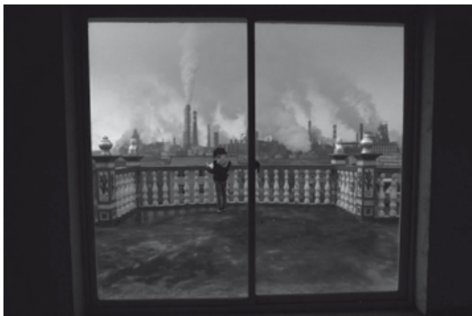
Inglaterra, século XIX? Non, China, século XXI.