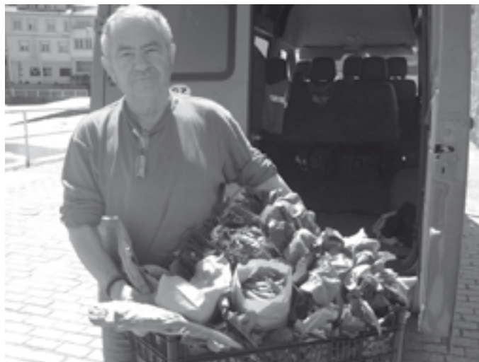
Reparto de cestas en Fisterra

Claro, con moita ilusión! Queremos seguir creando un agrosistema para a produción de alimentos sans e iso formúlase a medio-longo prazo, consolidando o proxecto, se é posible, axudando a fixar poboación, facendo de Quilmas unha referencia e punto de encontro para outros proxectos que teñan como horizonte o repecto ás persoas, ao contorno e ao ambiente. Habemos seguir traballando mentres agardamos que as políticas muden cara á sostibilidade.