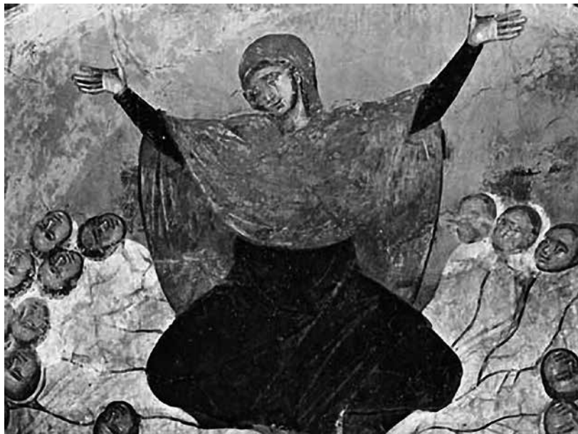
Raquel chora polos seus fillos. Fresco do século XIV (Mosteiro de Marko - Macedonia)

“A transcendencia e a inmanencia do mal convidanme a vivir a Deus doutro xeito e tal vez a falar doutro xeito da Boa Nova. Os discursos menos absolutos, os discursos da incerteza ou da diversidade parecen máis doados nestes tempos difíciles. (...) animame a converterme á realidade que percibo, esa realidade mesturada, confusa, na que ningunha palabra pode ser definitiva, na que ningún Deus pode ser todopoderoso, ningún ben totalmente soberano e ningún mal a última palabra da vida.” (El rostro oculto del mal. Una teología desde la experiencia de las mujeres, 2002).