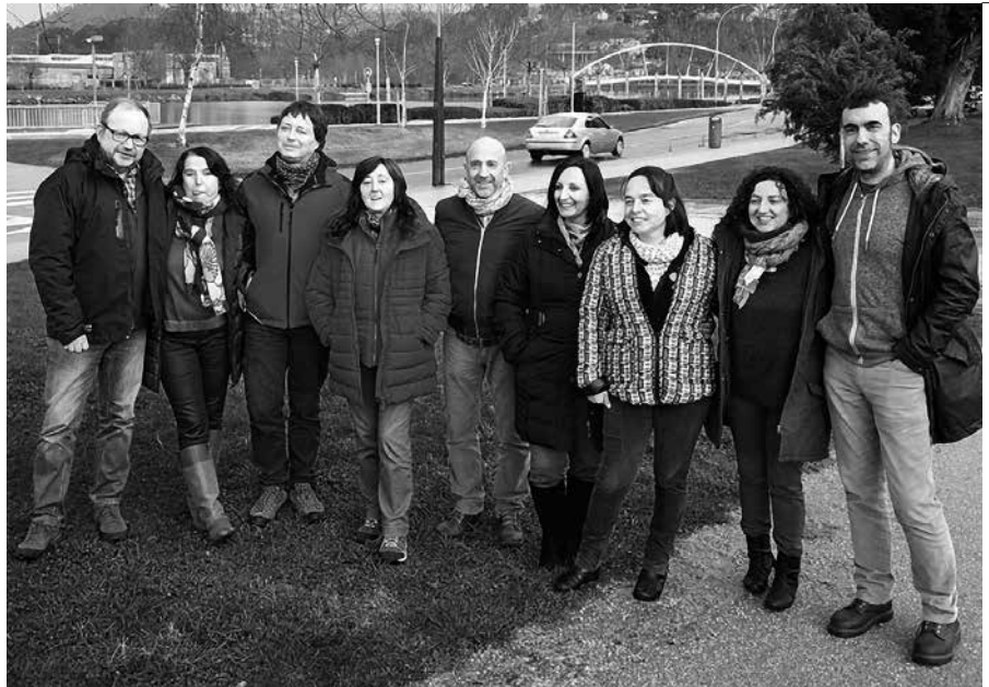
Maravallada ao completo