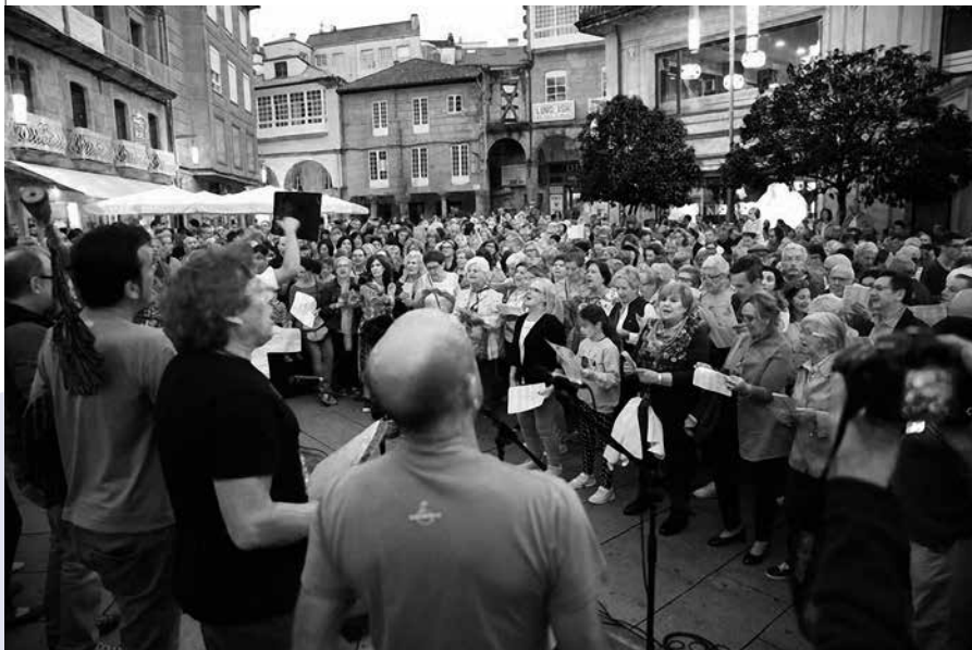
A praza de Curros Enríquez de Pontevedra no “Aquí cántase” 2019

“É precioso participar da comunión vocal”