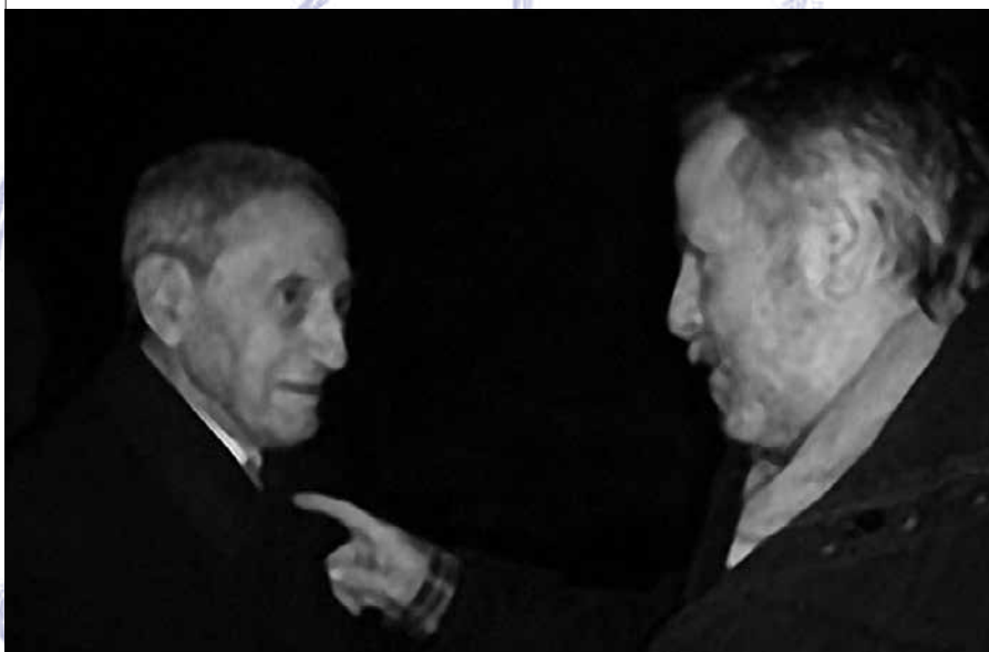
Acomodándolle o nó da garabata

As persoas que tivemos a sorte de atopalo no camiño, de ter oportunidade de coñecelo en distintas andainas, sabemos que esas vivencias compartidas forman parte da nosa fortuna. As máis antigas van dar a Sargadelos, lugar furtado para todos nós e sobre todo para el, pois era o eido onde se movía en liberdade, resistente en dignidade e coa cultura de país, desde as primeiras horas do día. Era o medio do seu mundo, entre formas e soños, no rigor. Momentos subvertidos nas escasas liberdades dos setenta e moitos, cando organizaba actividades e concertos no Salón de actos, onde dinamizaba como director ao ser o primeiro en abrir pola mañá, moi cedo ou de pechar cando o corpo llo pedía, normalmente tamén cedo, aínda que despois de marchar toda a xente e calzando o seu porte coma un operario máis. Lembro un concerto con Fuxan os Ventos nos anos oitenta, un concerto marabillado en amenceres e esperanzas.