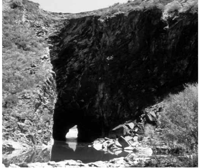
Montefurado no Sil

Entre as etapas de maior relevancia na historia de Galicia e que ademais ten unha importante manifestación no ámbito patrimonial, está o mundo dos castros prerromanos e galaico-romanos e as explotacións auríferas romanas, tanto sobre xacementos primarios (sobre rocha) como secundarios (de aluvión).