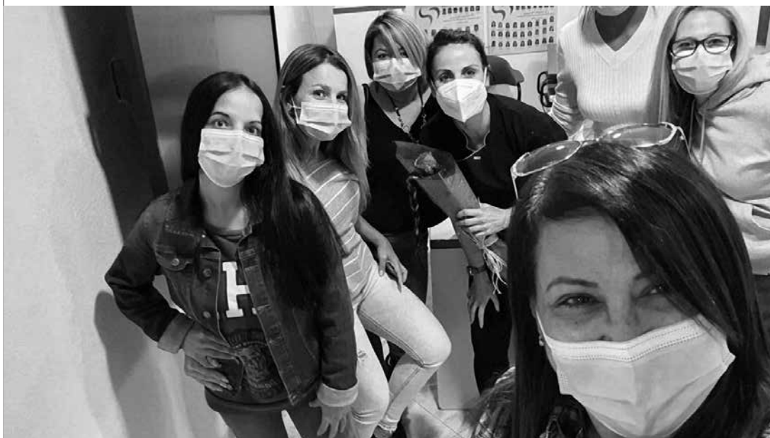
Aixa cunhas amigas

O dereito e o revés do acontecer. Todas amigas, todas fraternas. Dando e recibindo