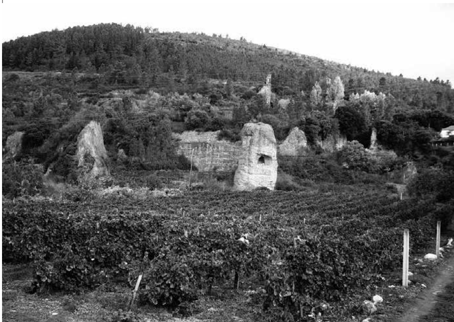
Meduliñas en Montefurado

Se temos tempo e imos con máis vagar, desde o Alto do Boi sae á esquer-