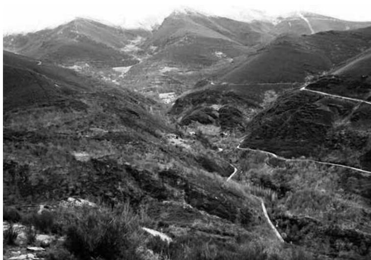
Val do Lor desde o Castro da Torre