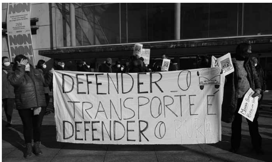
Defensa do servizo de transporte no Courel

Xorde como natural reacción de colectivos comprometidos coa situación de desfeita xeral que o mundo rural sofre. Nace da necesidade de reaccionarmos fronte a feitos coma os aquí referidos de Begonte e a montaña de Lugo. É o resultado da evolución dunha organización chamada Mesa Galega de Educación no Rural, activa durante máis de vinte anos, promovida por movementos de renovación pedagóxica e sindical