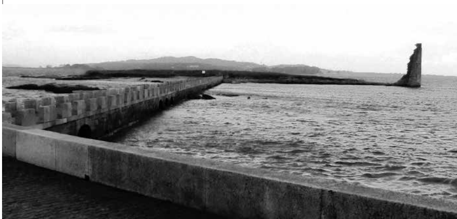
Torre de san Sadurniño en Cambados

‘La Galana’. Esta casa-museo, rodeada dun agradable contorno axardinado, mostra na planta baixa -as antigas cortes do pazo- unha exposición permanente con variada documentación sobre a vida e obra do autor, mentres na planta superior recreáse a vivenda coas súas distintas estancias e onde se pode ver parte da película ‘La malcasada’, na que aparece o propio Valle Inclán.