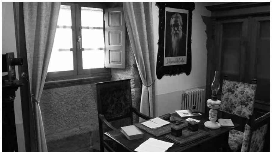
Museo Valle-Inclán en Vilanova de Arousa

Nel atópase o Pazo ou Casa do Cuadrante, onde se sitúa o nacemento de Ramón José Simón del Valle Peña, que logo se daría a coñecer na literatura como Ramón M a del Valle Inclán. Polas súas ventás e de mozo, o escritor vía o Xardín Umbrío, escoitaba historias populares, sagradas unhas e tremebundas outras, que lle contaba a vella