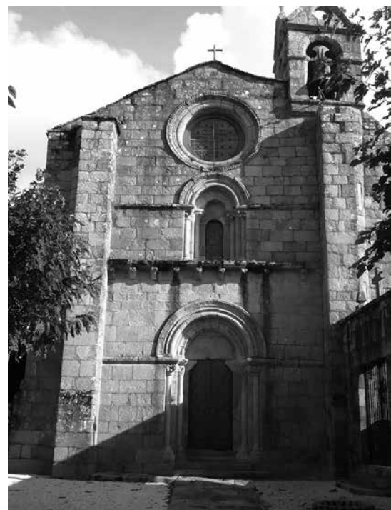
Fachada da igrexa de Sobrán

E se aínda temos tempo e vagar, moi preto e na estrada a Vilagarcía, veremos a monumental presenza do Pazo e a igrexa románica de S. Martiño de Sobrán.