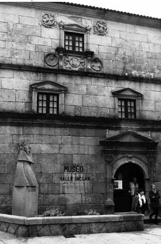
Museo Valle-Inclán na Pobra