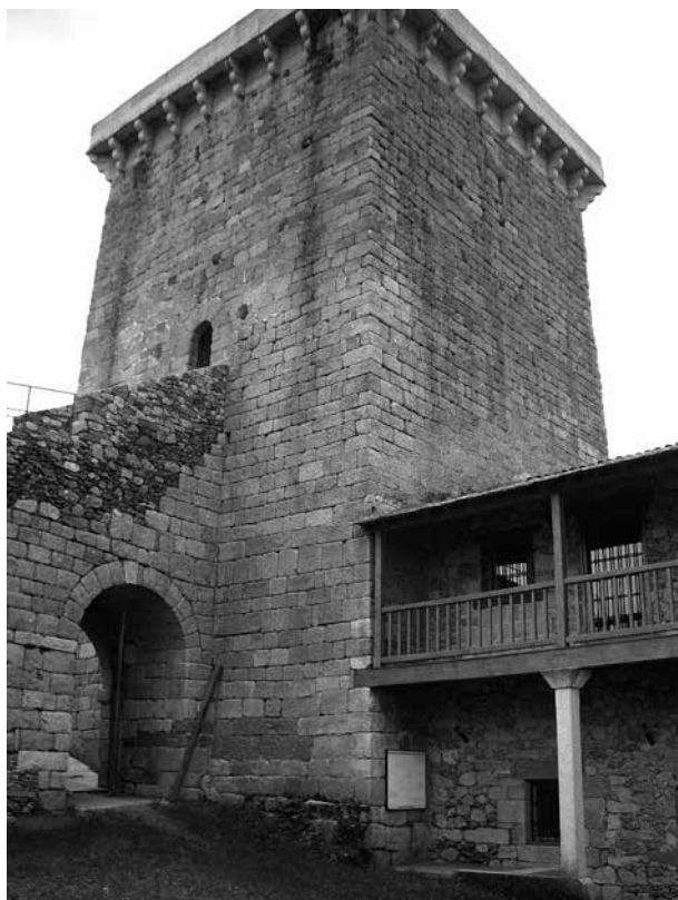
Castelo do Bolo

subindo pola vertente norte da Serra do Eixe, pola Portela do Valado, por riba dos 1000 m de altitude e entre impresionantes paisaxes montesíos, chegamos á parroquia de Prada, onde se atopa, nun desvío á esquerda, o moi singular enclave do Santuario do Cristo da Ascensión.