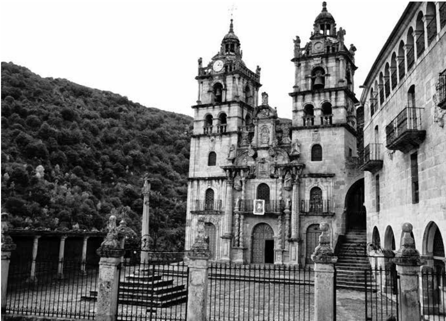
Santuario das Ermidas