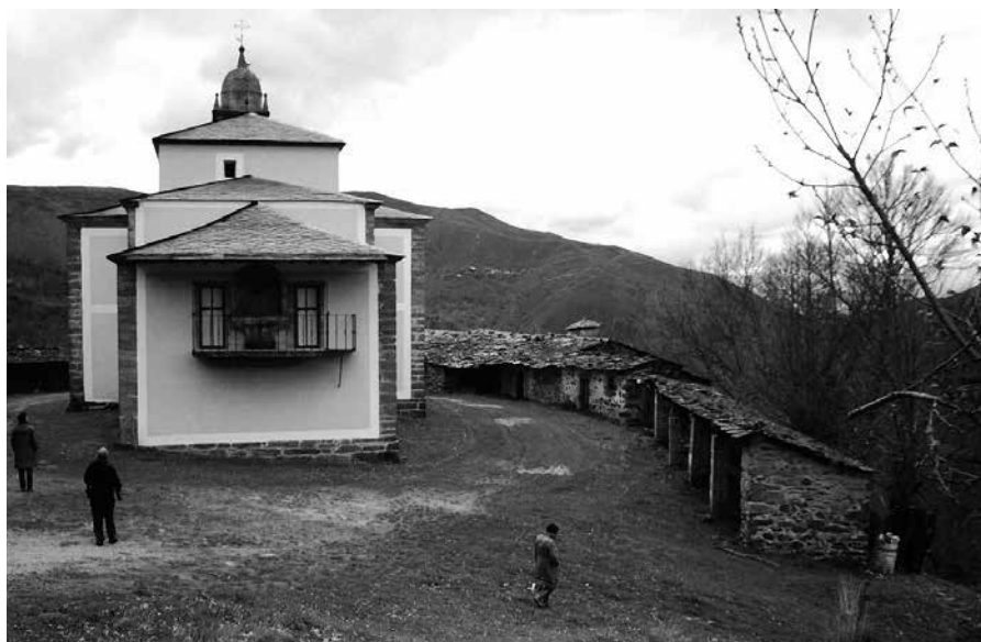
Santuario do Cristo de Prada

Seguindo a estrada que traíamos, e se non queremos volver sobre os nosos pasos cara á Veiga e O Bolo, a nosa viaxe pode rematar baixando ata o Sil, na zona do Barco de Valdeorras.