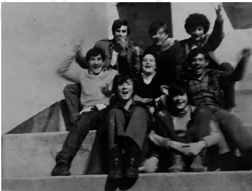
O colexido dos Milagres