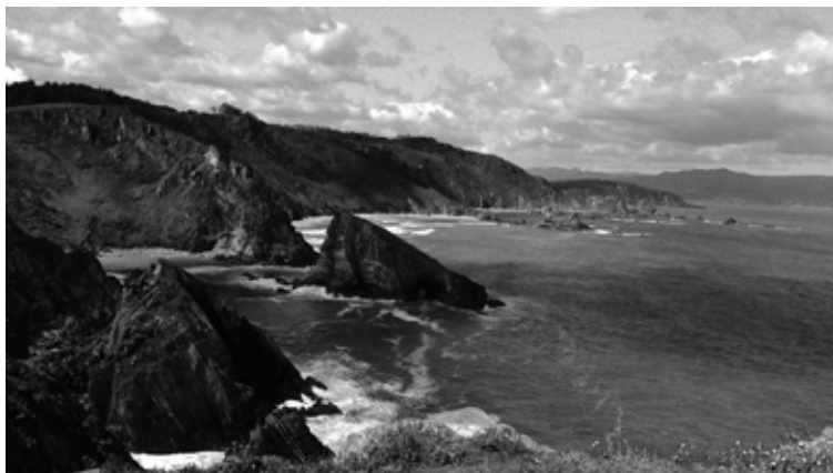
A costa de Ortigueira

Desde a punta do Cabo Ortegal, cos seus impresionantes Aguillóns (A Longa, O Rodicio, Os Tres Irmáns e, máis