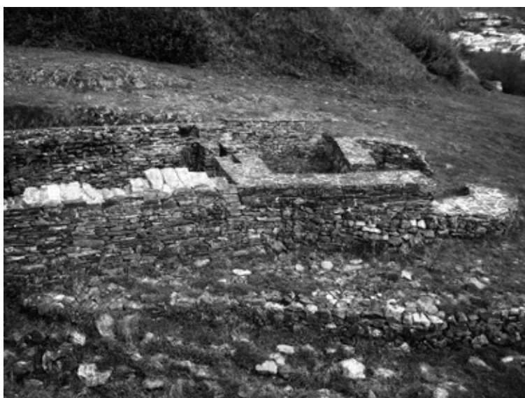
Sauna castrexa da Punta dos Prados