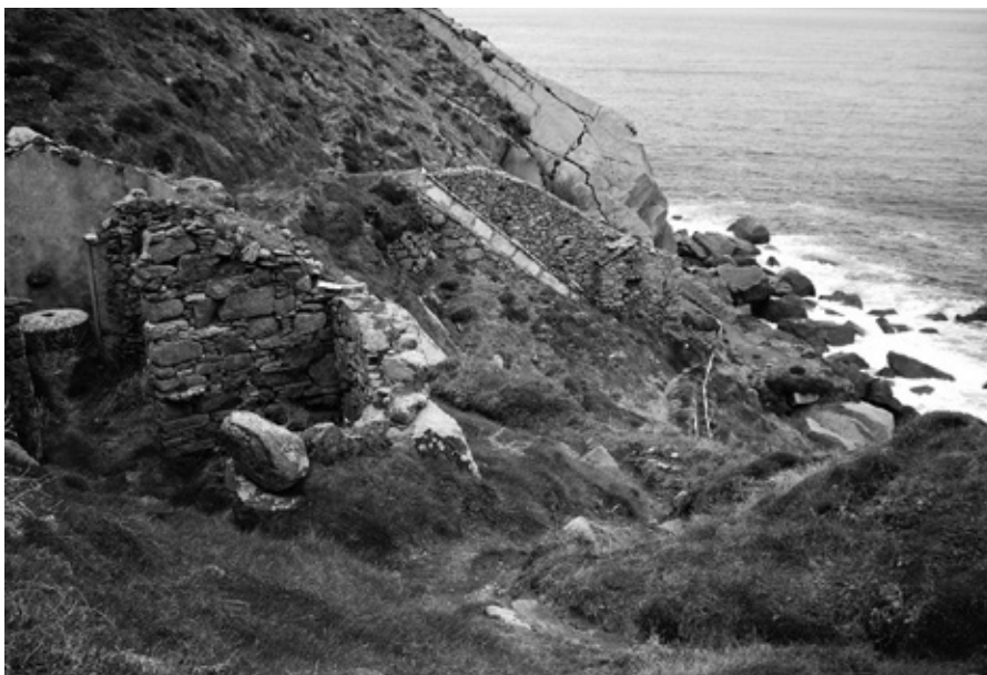
Muíños de torrenteira en Estaca de Bares

Cronista oficial de Ortigueira (1894), fundou e dirixiu o xornal El Ortegal , foi un dos primeiros membros da Real Academia Galega e formou parte de moitas outras entidades académicas e culturais galegas, españolas e portuguesas. Ata hai pouco, en Ortigueira tivo actividade unha Fundación co seu nome, dedicada a difundir a súa obra e a promover estudos arqueolóxicos.