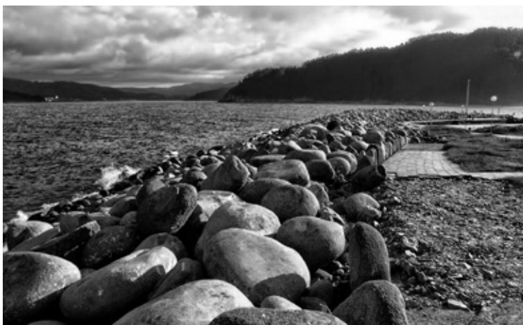
Coído do porto de Bares

Comezou as súas investigacións arqueolóxicas moi novo (a súa primeira publicación é de 1893), centrándose, como queda dito, na ampla zona entre