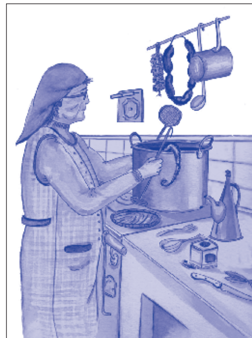
Ilustración: Manuel Riveira Rendó