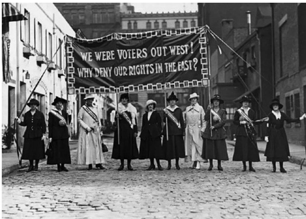
Movement polo sufraxio feminino.