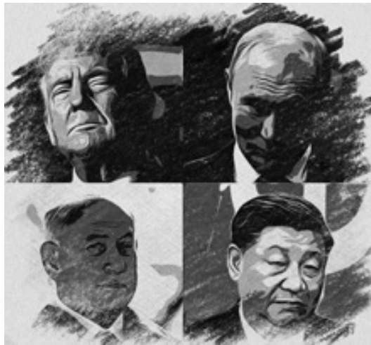
Os señores da guerra

Para xustificar o inicio oficial das hostilidades, recorrerase tamén aos manidos casus belli , sempre manipulados ou provocados. Lembremos a