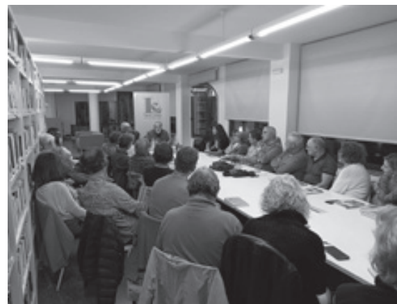
Club de narrativa Sete Vidas