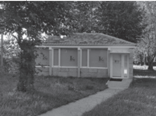
Casa da Lectura

En Galicia moitos nenos e nenas entran no colexio falando galego e saen falando castelán. Como credes que se podería reverter esta tendencia?