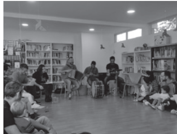
Sesión de Contos en Cueiros con integrantes de ‘A Banda dos Cueiros’

*Versión extendida en irima.gal // Máis información en espazolectura.gal