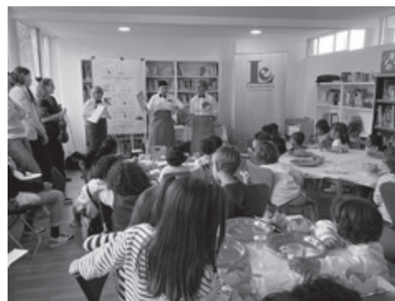
Menú de Contos na Casa da Lectura