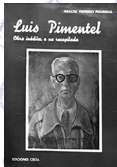
Obras de Araceli Herrero