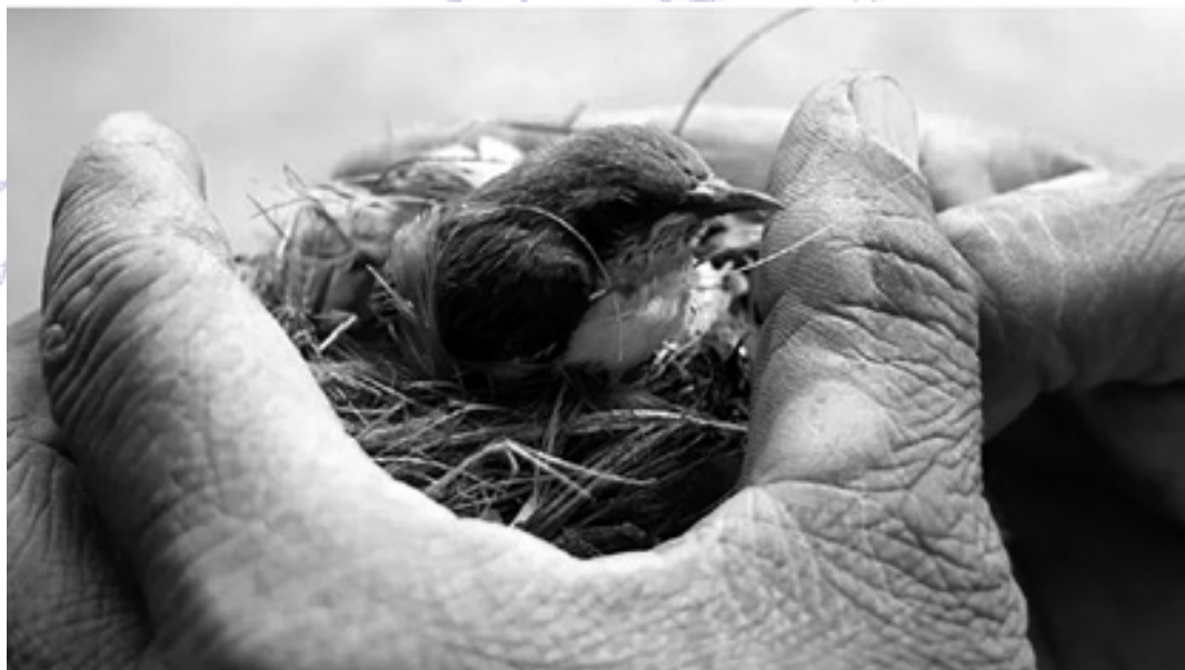
Grande é esa Natureza na que non reparamos.