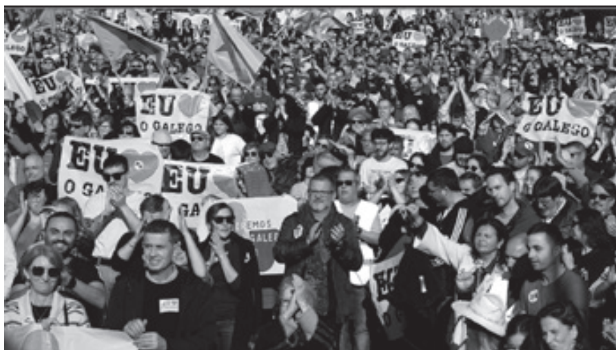
Miles de persoas participaron en febreiro do 2025 en Santiago de Compostela nunha manifestación para denunciar o que cualifican como unha “emerxencia lingüística extrema”

Para min esta actualización significa un facer que se fai, enredar e deixar pasar o tempo. Non críto os pasos que se están dando para desenvolver a actualización, senón a intención última. Para que se actualiza o PXML? Para eliminarlle ao anterior as medidas que buscaban un avance cara ao galego? Se é así, para que nos reúnen a sectores que saben que reclamamos esas medidas?