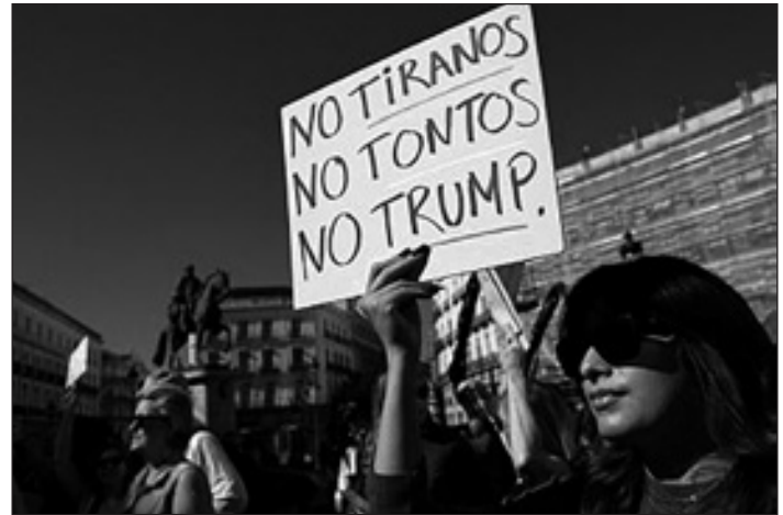
Protestas contra Donald Trump en Estados Unidos

O mandato de Trump reforzou as dereitas ultraliberais extremas