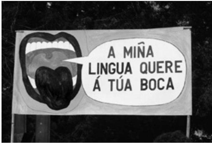
Manifestación de febreiro 2025.

“O plan de normalización non pode estar condicionado por quen considera o galego como unha lingua de segunda”