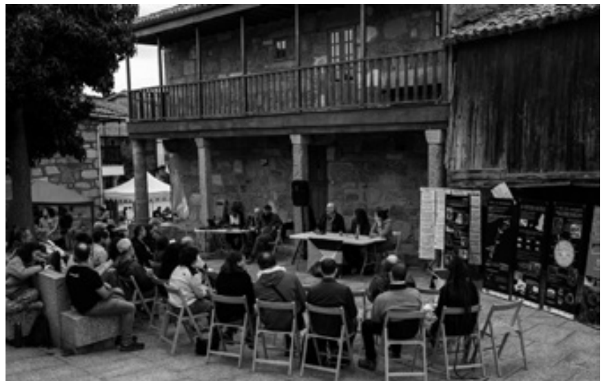
En setembro de 2025, Vilanova dos Infantes (Celanova) converteuse no epicentro dun encontro festivo e reivindicativo: o III Burla Verde pola defensa da Terra e da vida.

“O modelo extractivista, opresor e saqueador que ameaza o rural”